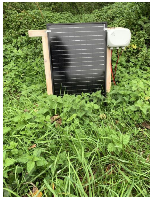
Figuur 1 Zonnepaneel voor oplading batterij elektrische harpen

Mensen, die graag nog een elektrische harp willen plaatsen voor hun kasten, kunnen materiaal ervoor nog aankopen bij de club. We hebben nog schragen, elektrische sturingen en bedradingslatjes in voorraad. Ondertussen horen we vele positieve reacties bij de gebruikers ervan. De hoornaars worden vrij makkelijk geëlektrocuteerd, om vervolgens te verdrinken in de bak met sopwater.