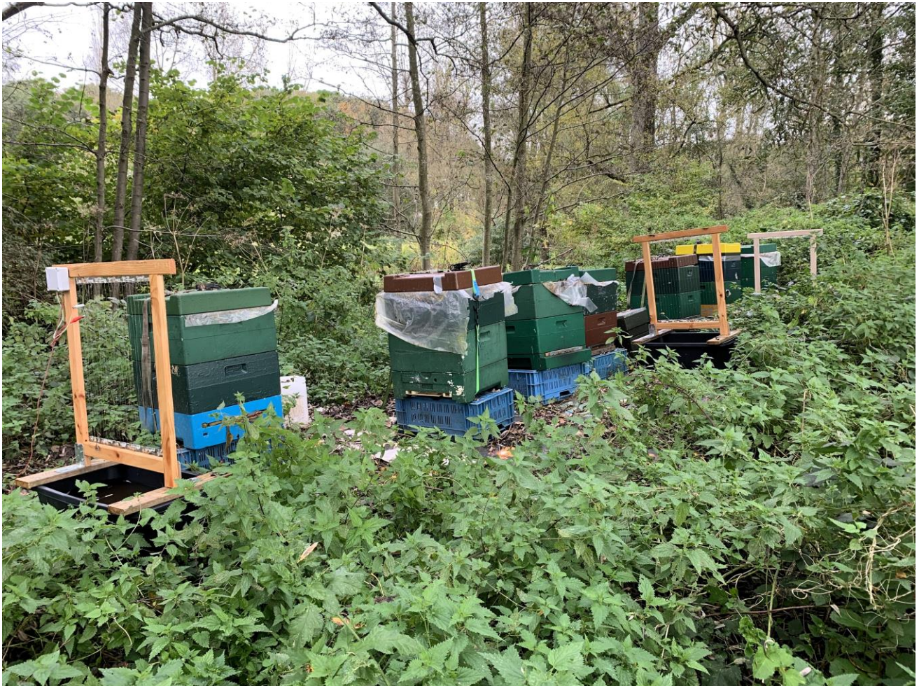
Figuur 2 elektrische harpen bij rij bijenkasten