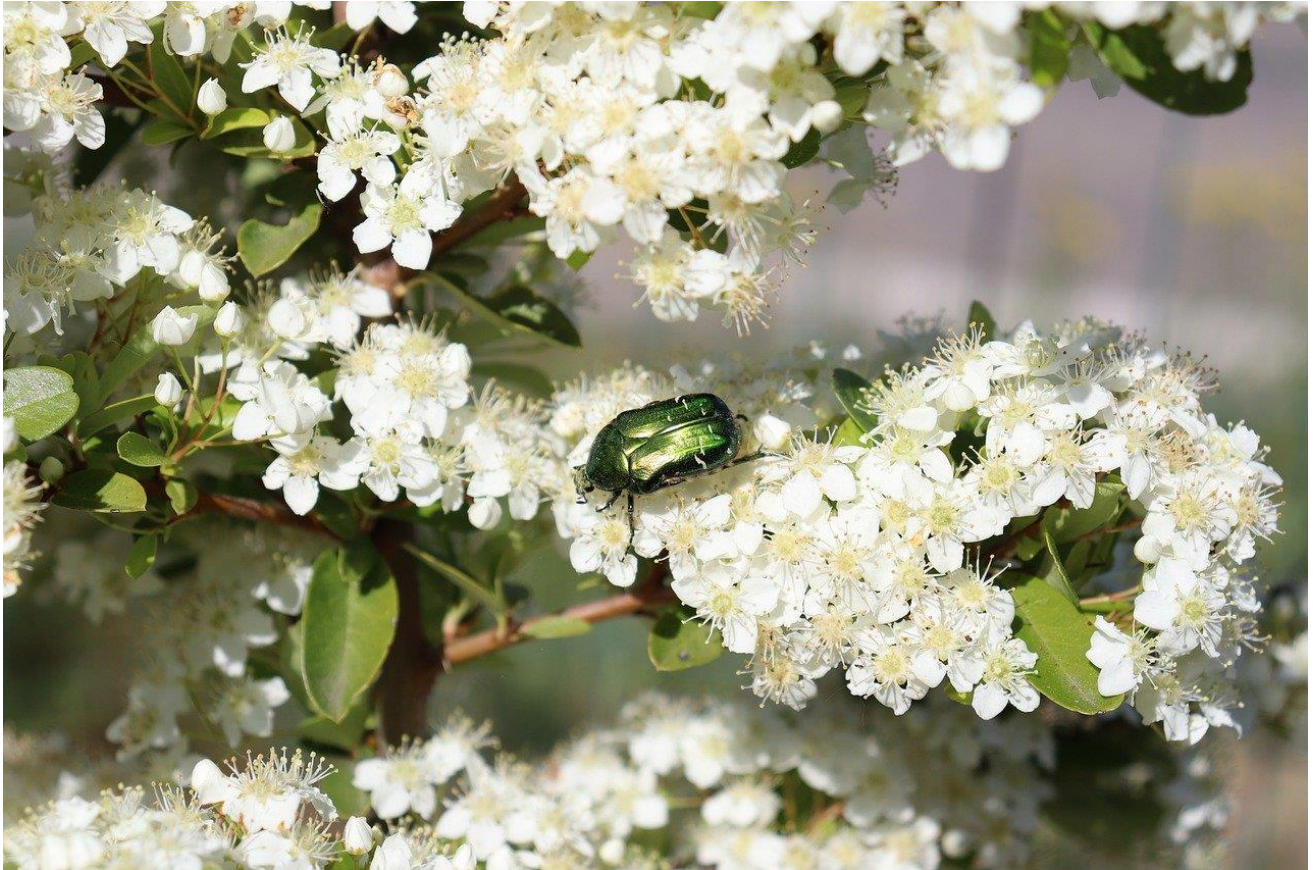
Figuur 4 cotoneaster

IN HET VOORJAAR KOMEN DE AZIATISCHE HOORNAARKONIGINNEN HEEL VAAK NAAR DE BLOEMEN ERVAN. ZO KAN JE MAKKELIJK KONIGIN OPRUIMEN MET VLINDERNET.