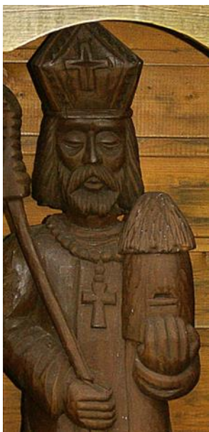
Figuur 3: Sint Ambrosius

Onze spreker Eddy Nowicki, voorzitter bij Bijenvrienden Kempen, zoekt de oplossingen zonder gebruik te maken van chemische producten.