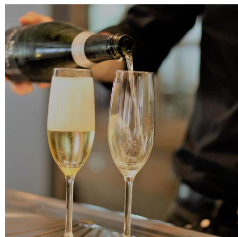
Figuur 3 Gezondheid !