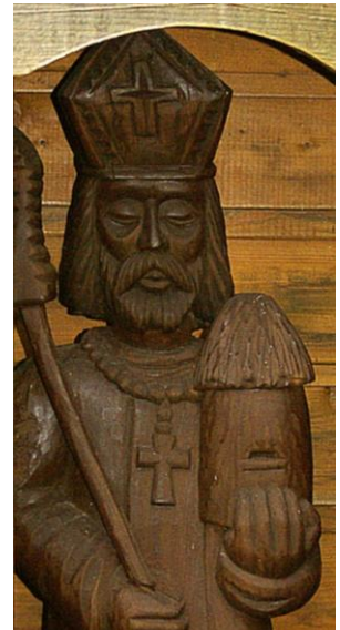
Figuur 2 Sint Ambrosius

December is een echte feestmaand. Sinterklaas, Sint Ambrosius, kerstmis ..... worden allemaal gevierd in de laatste maand van het jaar. Om onze patroonheilige te vieren, delen we een cadeautje uit onder de aanwezige imkers. Lekker snoep !!!