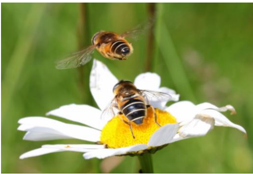
Figuur 1 Gewone zandbij

Krijgen jullie ook vragen van mensen over wilde bijen? Regelmatig telefoneren mensen me op met de vraag om een bijenzwerm te komen scheppen. IJverige natuurliefhebbers, die onze bijen willen helpen. Ik stel een paar vragen, en dan is het duidelijk dat het over solitaire bijen gaat. We hebben wel enige kennis over solitaire bijen, maar echt goed is die niet.