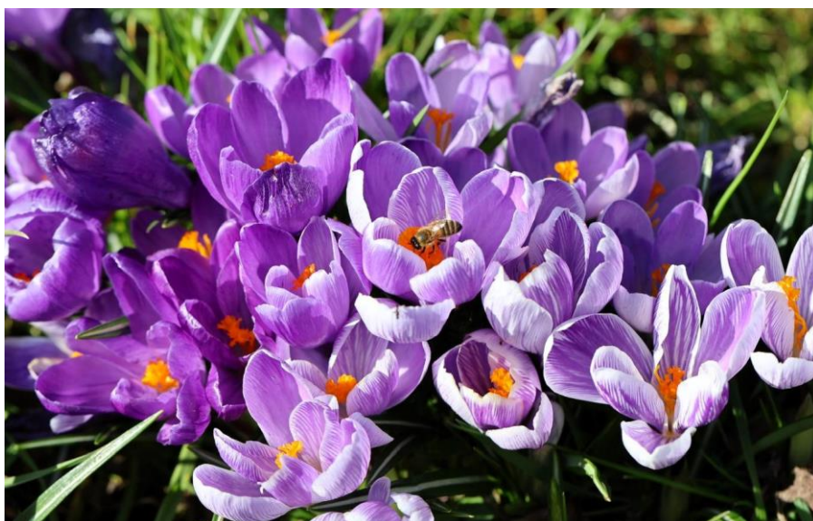
Figuur 1 De start van het nieuwe jaar