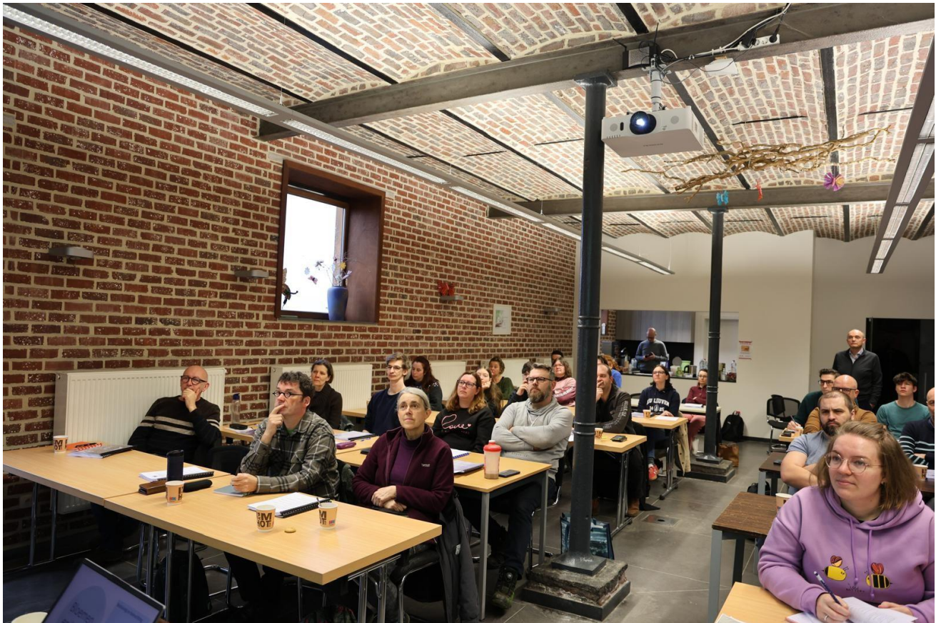
Figuur 4 De cursisten volgen heel aandachtig de les.

38 enthousiaste cursisten gaven present op de eerste lesdag. Ze zetten hun eerste stappen in de wondere wereld van de bloemetjes en de bijtjes.