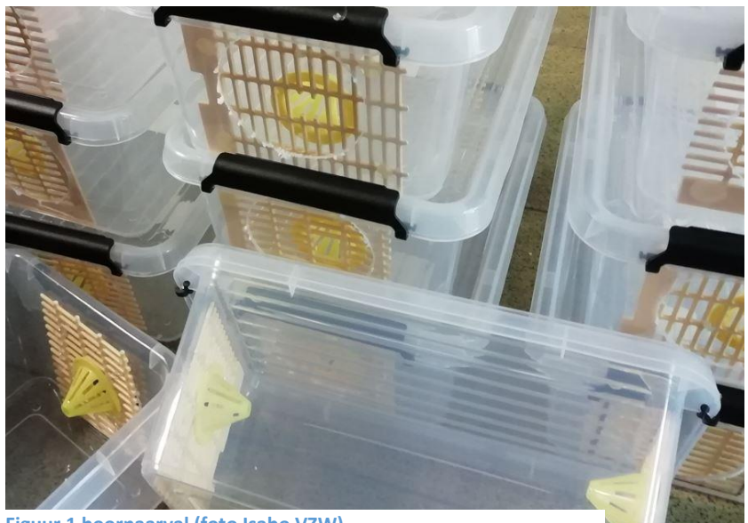
Figuur 1 hoornaarval

Daarom gaan we vallen maken om de Aziatische hoornaarkoninginnen in het voorjaar te vangen. Voor de ronde prijs van 5€ kan je een val komen maken. We volgen het voorbeeld van onze collega's van ISABO. We nemen een plastic bak. Daarin boren we 2 gaten van 8 cm, die we afdichten