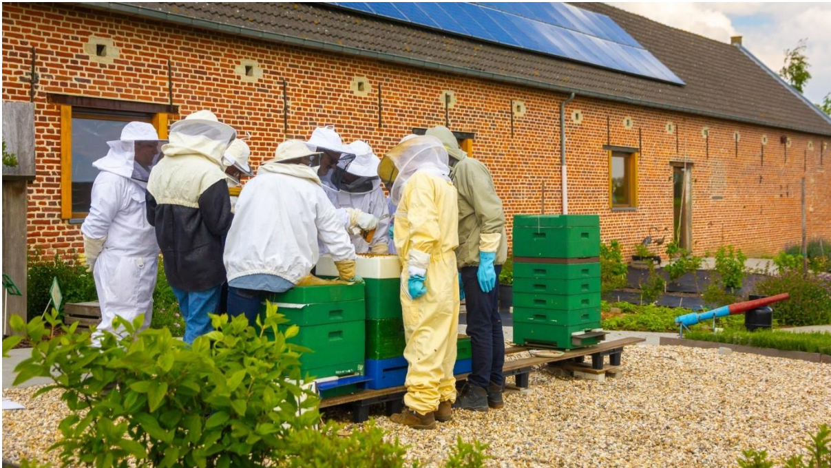
Figuur 4 cursisten aan de bijenkasten tijdens de praktijklessen

Boerderij Hof ten Bosch, de Limburg Stirumlaan 66, 3040 Huldenberg.