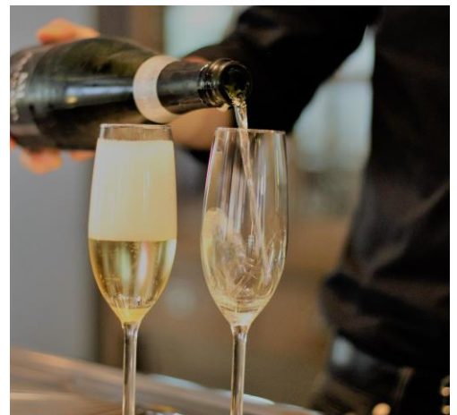
Figuur 4 Gezondheid !