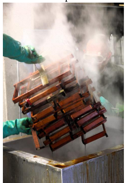
Figuur 2 ramen komen uit loogbad

Naar jaarlijkse traditie worden oude uitgesmolten ramen ontsmet en gekuist. De ramen stoppen we in een kokend natriumloogbad van 5%. Nadien worden de ramen 2X gespoeld. De ramen zijn nu proper en gedesinfecteerd. Wanneer de ramen droog zijn kan je ze opnieuw klaar maken voor je bijenvolken. De draden opnieuw aanspannen,