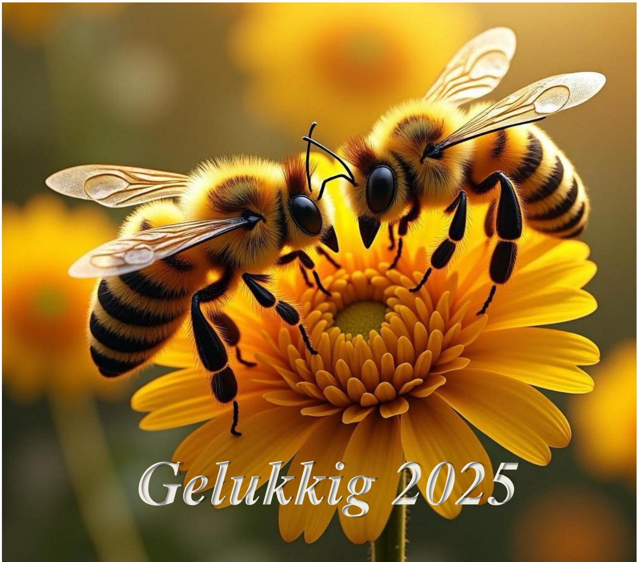
Figuur1 bijen wensen elkaar gelukkig nieuwjaar (gecreëerd met AI, DaVinci)