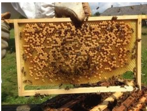
1: Beeld van het hagelschotbroed

Dit jaar doken er abnormale zaken op in de bijenkasten. Imkers hebben was aangekocht in de handel. Eenmaal in de kast bouwden bijen de raten zeer slecht op ( ze knaagden zelf stukken waswafel weg ). Nadien belegde de moer de ramen. Het broed was zeer onregelmatig, en zeer veel eitjes verdwenen.